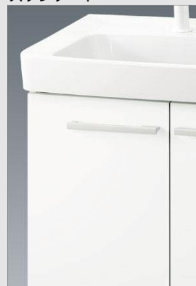
VP1W 扉：VP1(ホワイト) 洗面器：BW1(レリアホワイト)