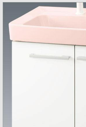
VP1P 扉：VP1(ホワイト) 洗面器：LR8(レリク)