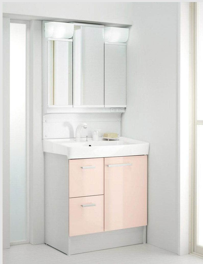
写真はイメージです。見積り内容とは異なります。